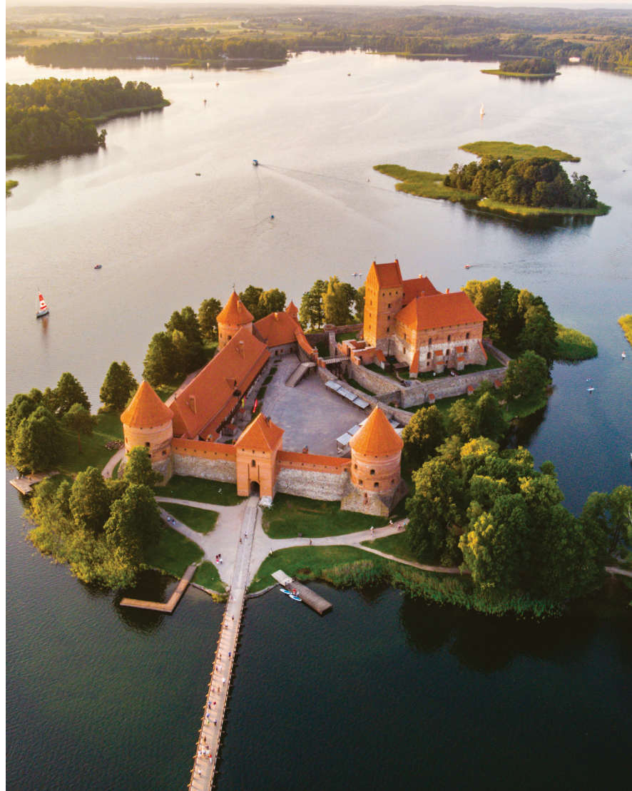
Trakai island castle

Pilies vaizdas yra tarsi tiesiai iš pasakos. Ją pasieksite perėję ilgą medinį tiltą, o viduje esančiame muziejuje rasite didžiųjų Lietuvos kunigaikščių parodas, įvairius archeologinius radinius ir meno kolekciją. Vasarą vidiniame pilies kieme vyksta viduramžių festivaliai, įvairūs renginiai ir koncertai. Trakų kurortinės zonos ištekliai yra puikiai pritaikyti medicinos ir sveikatingumo keliautojams, tai ir puikus klimatas, ir grynas oras, žali miškai ir ežerai. Ištisis metus čia nenutrūksta aktyvi veikla, kur turistai ir vietiniai mėgaujasi sveikatingumo procedūromis, sportu, koncertais ir kultūrinėmis pramogomis.