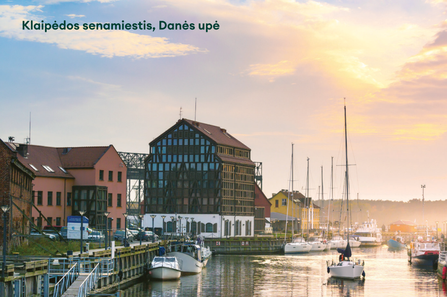
Klaipėdos senamiestis, Danės upė

Tai šiauriausias neužšąlantis uostas rytinėje Baltijos jūros pakrantėje ir vienintelis uostas Lietuvoje. Tai ir vartai į Kuršių neriją – nuostabių smėlio kopų ruožą. Kultūra, ramybė ir kūrybiškumas, šie trys žodžiai puikiai apibūdina uostamiestį. Klaipėda stebina turtingu kultūriniu gyvenimu ir istoriškai tai bene turtingiausias Lietuvos miestas, kuris nuo sostinės Vilniaus ir Kauno skiriasi savo architektūra, pastatais, vingiuotomis ir akmenimis grįstomis gatvėmis. Vaikštinėdami po senamiestį atrasite daugybę puikių kavinių, muziejų, galerijų ir vietinių restoranų.